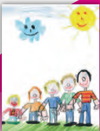
Une enfant de sept ans non atteinte de TSAF a dessiné sa famille

Environ 4000 enfants atteints de TSAF et des handicaps y étant liés naissent chaque année en Allemagne. Le triste chiffre réel est entre 10.000 et 15.000 nouveau-nés atteints.