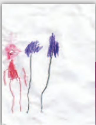
Une enfant de sept ans atteinte de TSAF a dessiné sa famille

La désignation TSAF (troubles du spectre de l'alcoolisation fœtale) comprend ces troubles et bien d'autres, pouvant être causés par la consommation d'alcool pendant la grossesse.